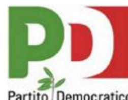
GRUPPO CONSIGLIARE "PARTITO DEMOCRATICO" DI CASTELFRANCO EMILIA