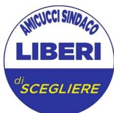
GRUPPO CONSIGLIARE "LIBERI DI SCEGLIERE" DI CASTELFRANCO EMILIA