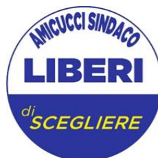
GRUPPO CONSIGLIARE "LIBERI DI SCEGLIERE" DI CASTELFRANCO EMILIA