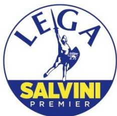
GRUPPO CONSIGLIARE "LEGA SALVINI PREMIER" DI CASTELFRANCO EMILIA